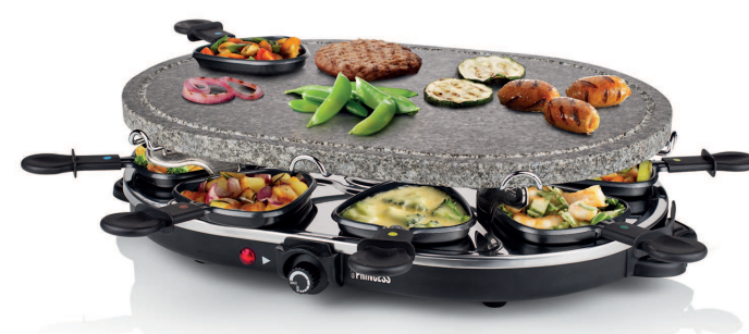
Raclette 8 Oval Stone Grill Party 01.162720.01.001

PARTS DESCRIPTION / ONDERDELENBESCHRIJVING / DESCRIPTION DES PIÈCES / TEILEBESCHREIBUNG / DESCRIPCIÓN DE LAS PIEZAS / DESCRICÃO DOS COMPONENTES / DESCRIZIONE DELLE PARTI / BESKRIVNING AV DELAR / OPIS CZĘŚCI / POPIS SOUČÁSTÍ / POPIS SUČASTI