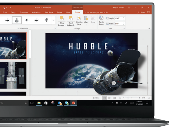
3D in PowerPoint

Office 365 werkt het beste met Office 2016, Office 2013, en Office 2016 voor Mac. Eerdere versies van Office, zoals Office 2010, Office 2007, en Office voor Mac 2011 hebben in combinatie met Office 365 mogelijk beperkte functionaliteit. Lees meer informatie over de ondersteunde Office-versies op products.office.com/nl-NL/office-system-requirements . Voor de toegang tot Office en het downloaden, installeren of activeren van Office, is een internetverbinding vereist.